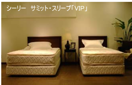
シーリー サミット・スリープ「VIP」

この新商品の発売を記念し、6月16日(月)よりシーリージャパンのホームページでは、ザ・ウィンザーホテル洞爺リゾート&スパのペア宿泊券1組2名様へのプレゼントを実施いたします。世界各国の首脳が滞在するラグジュアリーホテルでの至福の寝心地をご体感いただけます。またWチャンス賞として、宿泊券にはずれた方の中から抽選で100名様に、紙マッチ状の植物栽培キット『グリーンスティック』をプレゼント。環境意識の改革に繋がる小さな種を日本各地に届けます。