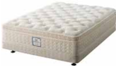
写真;オーソペディック・コレクション 「ハニーデュー」 シングル価格;税込178,500円

2006年、シーリー社では社外の有名大学・医療機関で活躍している著名な整形外科医・研究者8名で構成された「整形外科諮問委員会(Orthopedic Advisory Board;以下OAB)」を結成し、整形外科医学の見地に基づいた研究開発を進めてきました。今回の刷新にあわせ、OABの助言により開発された新しいコンセプトの詰め物層「プレッシャーリリーフ・インレー」が中～高価格帯の3シリーズに加えられています。